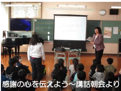
感謝の心を伝えよう～講話朝会より

3月は、これから、6年生を送る会や卒業式、終了式、離任式など、人に感謝したり、自分の成長を振り返ったり、新たな希望をもつ機会がたくさんあります。その時にきっと「ありがとう」の言葉の意味をかみしめられると期待しています。